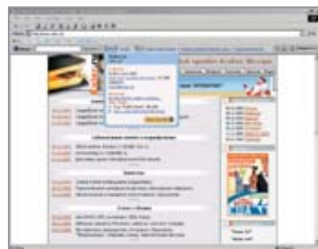
8 Вся информация о сайте одним кликом с помощью Alexa

иска (можно искать на Google.com, в магазине Amazon.com, на текущем сайте и даже в различных словарях и энциклопедиях), кнопка для получения информации о текущем сайте (включая показ всех страниц, на которые ведут ссылки с этого сайта), средний уровень его посещаемости, список сайтов похожей тематики и еще несколько кнопок и ссылок. Что приятно, в рейтингах и тематических списках не забыты российские сайты. Помимо всего вышеперечисленного, Alexa также справляется со всплывающими окнами. К несчастью, Alexa считает поп-ап ссылки, открывающиеся в новом окне. Если вы указали, чтобы всплывающие окна от определенного сайта никогда не открывались, то и ссылки этого сайта в новом окне вы больше не увидите, пока не измените установку.