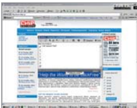
9 И что же мы напишем про журнал Chip в настройках закладок Marker?

Этот тип программ обычно называют Advanced Bookmarks Manager. Marker раз-