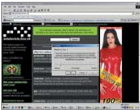
4 В настройках FireBall можно указать время закрытия окон

» меется, это происходит, только если программа сумеет распознать рекламу, но в большинстве случаев она справляется со всеми известными окнами и баннерами. Исключение составляют баннеры с Flash-анимацией, которые, как правило, приходится блокировать вручную. Несмотря на то что AdsOff! относится к категории условно-бесплатных программ, никаких ограничений в незарегистрированной версии обнаружено не было. К сожалению, разработчик перестал поддерживать плагин, и он автоматически поменял статус на freeware.