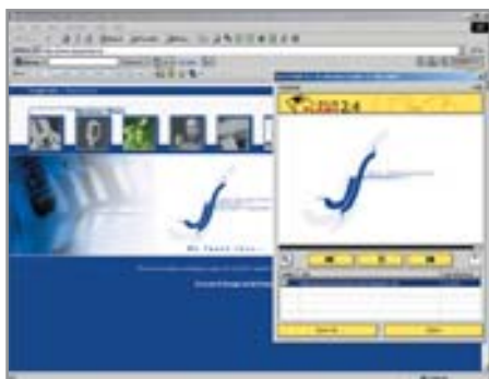
1 С помощью Save Flash можно сохранить любимый ролик

» помещает на нее открытые окна Internet Explorer (по желанию пользователя, а также и стандартного Проводника), убирая их с основной Панели задач. Помимо этого, Switch! может автоматически разворачивать новые окна во весь экран (игнорируя ограничения, выставленные Java-скриптами) или помещать неразвернутые окна в определенную точку экрана. Еще одна функция программы: при закрытии Switch! окна IE остаются невидимыми на Панели задач, открыть их можно только через комбинацию клавиш «Alt+Tab». Единственный недостаток: программа игнорирует существование автоматически убирающейся основной Панели задач, что приводит к тому, что она прячет под ней свое окно. За исключением этого программа Switch! более чем удобна и всячески рекомендуется всем любопытным серферам, открывающим по 20–30 окон любимого браузера.