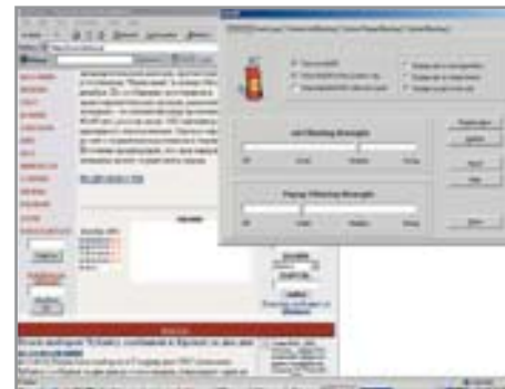
5.2 С помощью AdsOff! пользователь убирает рекламу

Достойная альтернатива известному офлайн-браузеру Teleport Pro. Как и Teleport, PageSaver умеет сохранять веб-страницы на жестком диске для последу-