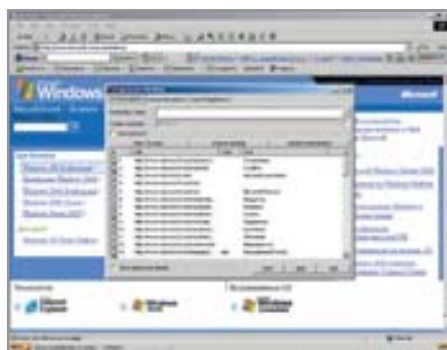
7 PageSaver может скачать даже Microsoft.com