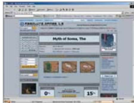
2 Работа с окнами IE становится проще благодаря Switch!

Эта программа имеет лишь одну функцию — закрытие всплывающих окон (pop-up). Надо сказать, справляется она со своим делом более чем достойно. Правда, при нажатии «Ctrl+N» нового окна браузера тоже не открылось: FireBall сочла его pop-up. Новые окна, вызы-